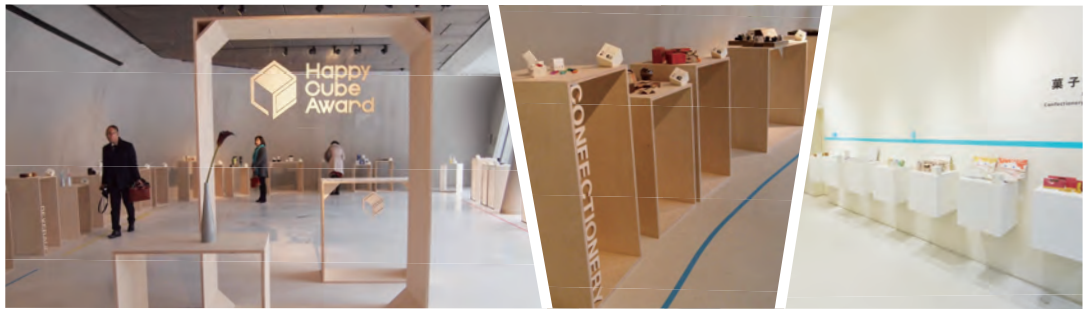
※画像はすべて過去の作品展のものです